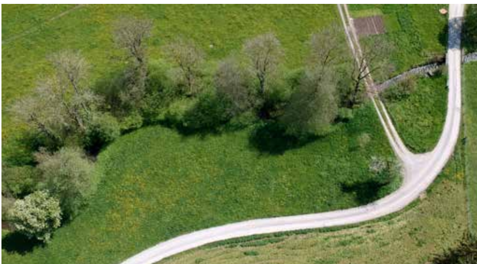
Nutzfläche 0,5 ha